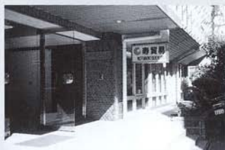
工作機械というと工業用で、大きすぎるものが多い。しかし寿貿易は、個人使用にほどよい大きさの旋盤やフライス盤を販売している。