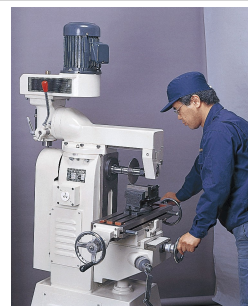
横フライス盤として使用中