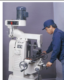
横フライス盤として使用中